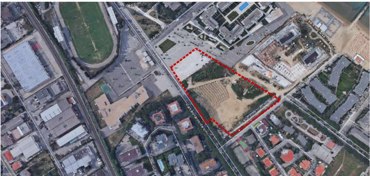
Area di intervento

L'area d'intervento è situata nel il centro abitato di Silvi Marina in località Piomba e confina a Sud/est con Via Adige, a Sud/Ovest con Via L. Da Vinci, a Nord/Ovest con la piazza pubblica prospiciente su Via Rubicone, a Nord/Est con gli altri lotti residenziali già attuati. Tali condizioni di visibilità permettono un'immediata visione ed una chiara percezione del lotto nella sua interezza.