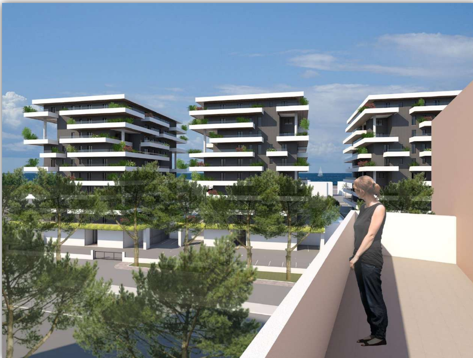
08_RENDERING: PARTICOLARE DELLA VISUALE DA OVEST