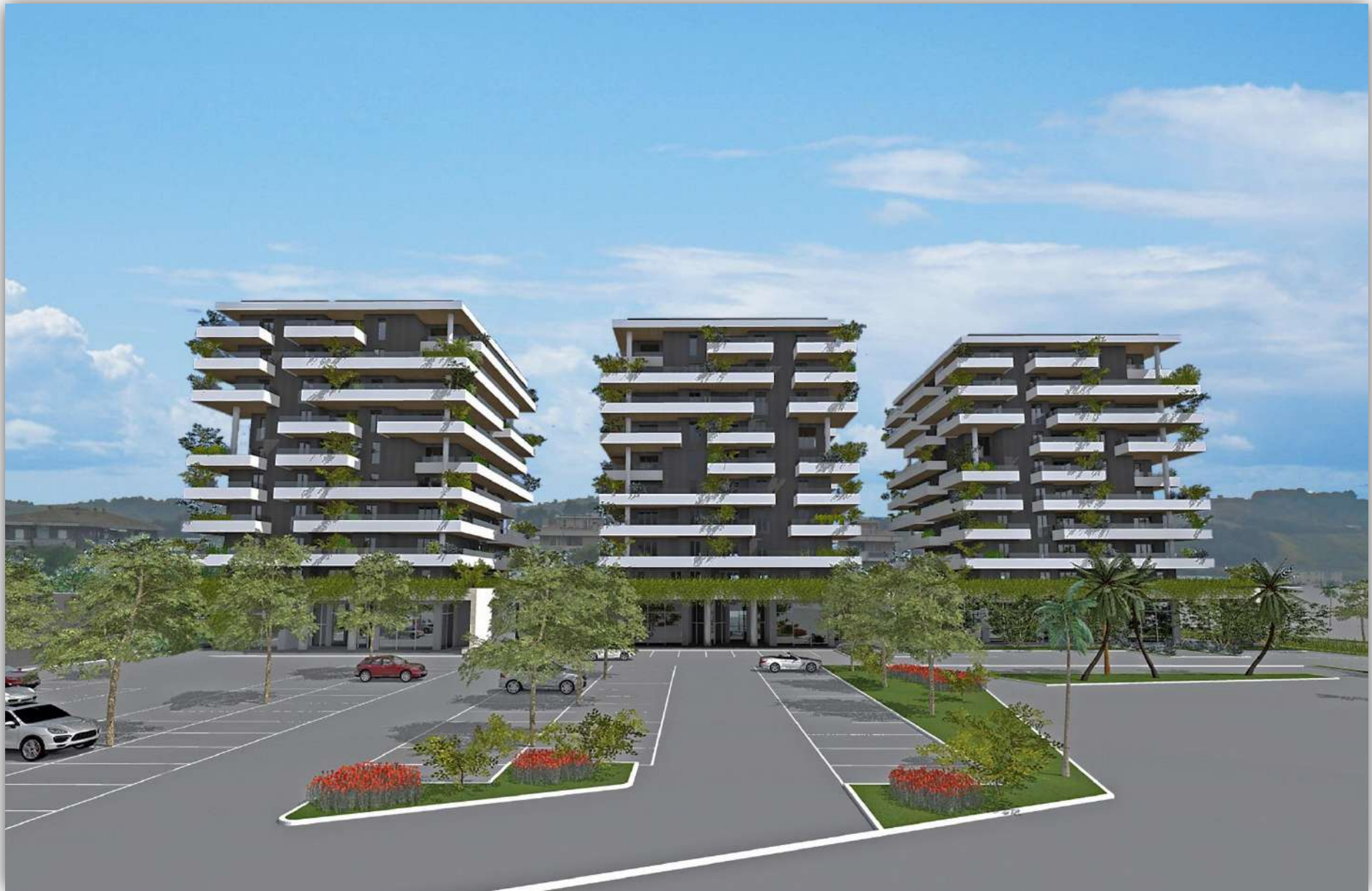
07_RENDERING: VISTA DA EST