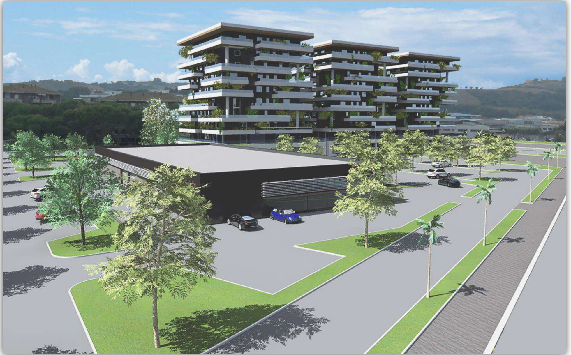
O3_RENDERING: VEDUTA DA SUD-EST