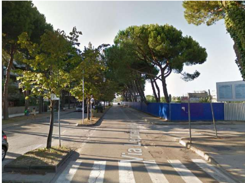
Essenze arboree esistenti

Il lotto è completamente pianeggiante. Le uniche essenze arboree presenti sono i pini marittimi ubicati solo lungo Via L. Da Vinci senza costituire un agglomerato tale da essere considerato un sistema naturalistico, comunque pienamente salvaguardati nell'assetto planimetrico proposto.