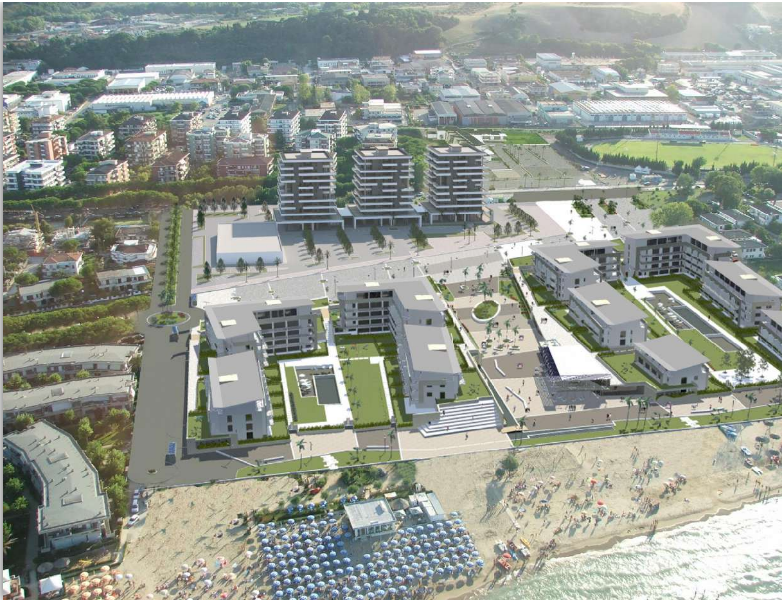
01_RENDERING: VEDUTA AEREA DA EST