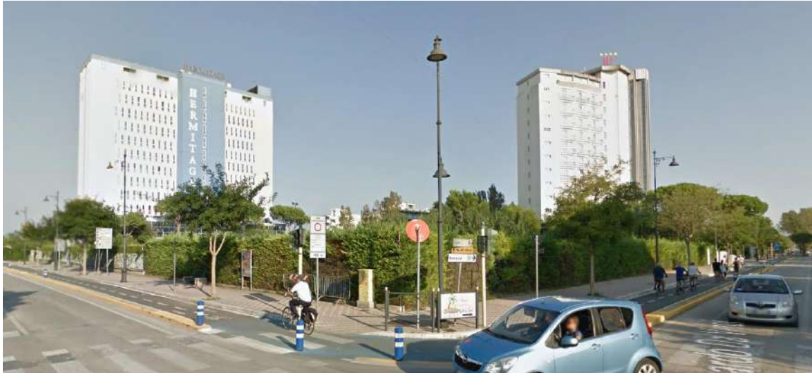
Edilizia alberghiera esistente

Per quanto concerne invece lo specifico Piano di Lottizzazione, i lotti residenziali già attuati costituenti il complesso residenziale Le Dune, sono caratterizzati da una serie di edifici articolati in modo da costituire due ampie corti private rivolte verso il mare adibite a verde attrezzato con piscina e relativi spazi di pertinenza.