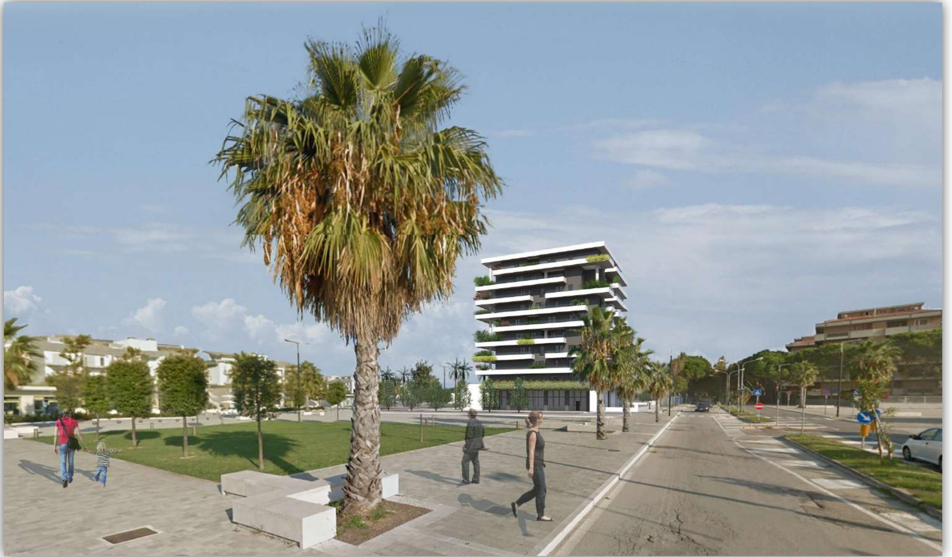
04_RENDERING: VISTA DA NORD