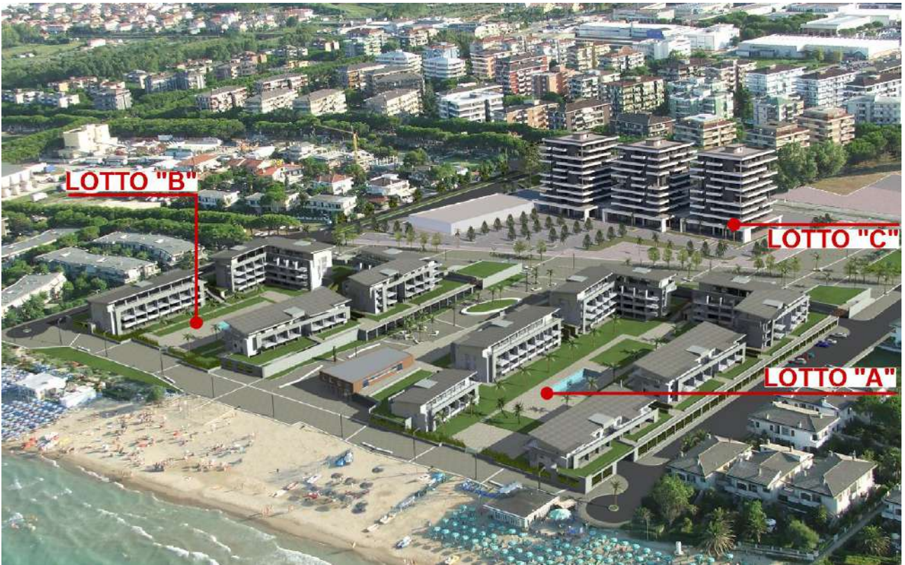
Progetto di Variante al Piano di Lottizzazione: Veduta aerea da Nord-Est