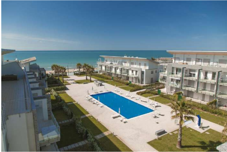
Complesso residenziale Le Dune – Lotto B

I due lotti costituiscono un nuovo polo urbano, dotato di diverse attività commerciali e di specifici servizi di quartiere prospicienti sugli ampi spazi di verde attrezzato con relative aree pedonali. L'impostazione planimetrica generale ha garantito la piena fruibilità degli spazi pedonali, resi del tutto indipendenti dai flussi di traffico veicolare.