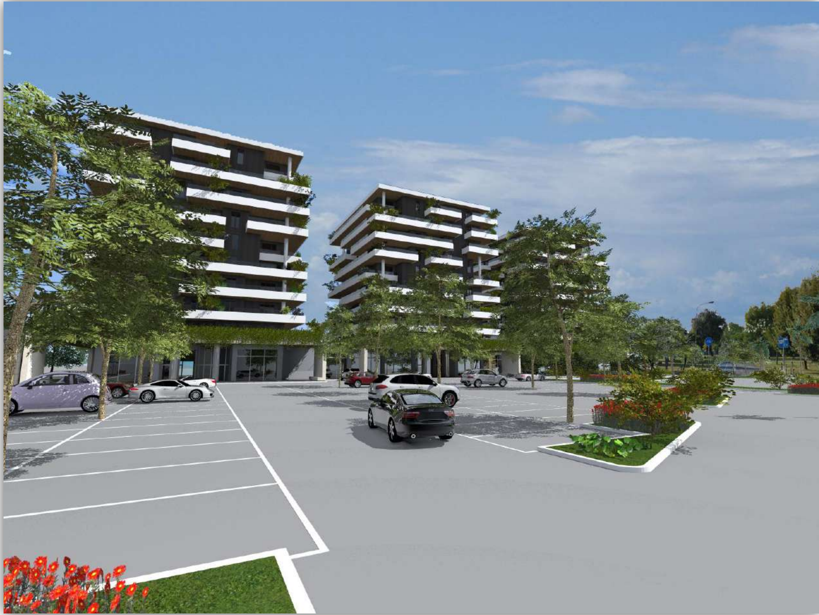
06_RENDERING: VISTA DA SUD-EST