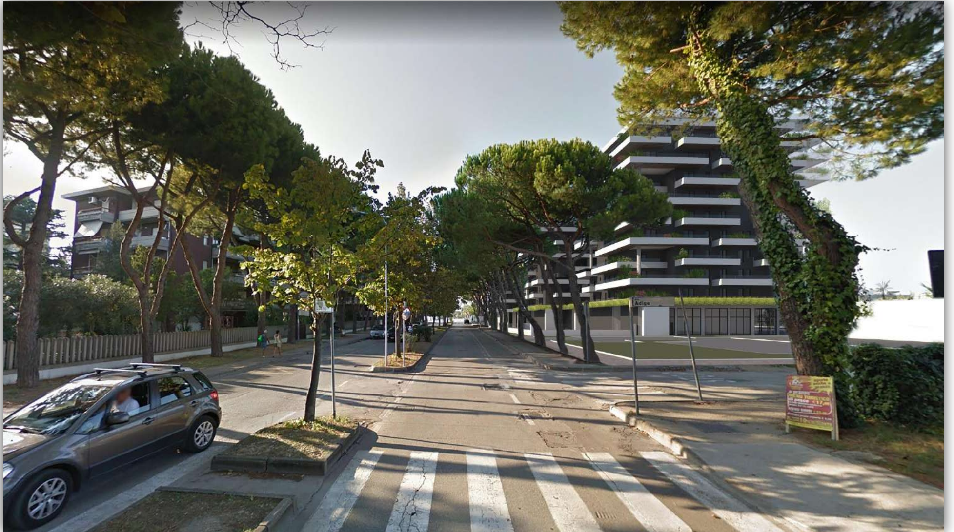
05_RENDERING: VISTA DA SUD