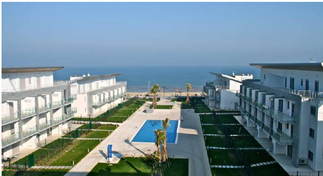
Complesso residenziale Le Dune – Lotto A

Tali edifici, di quattro piani ciascuno con tetti a pendenza minima, presentano prospetti moderni con ampi balconi prospicienti la corte interna.