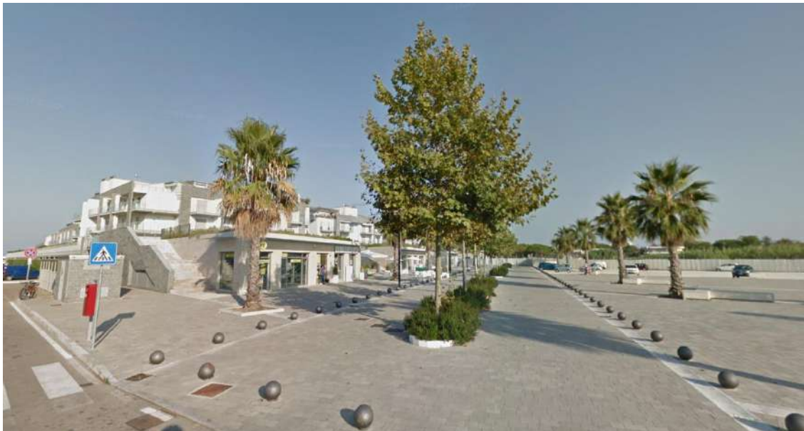
Complesso residenziale Le Dune – assetto urbano

I due lotti costituiscono un nuovo polo urbano, dotato di diverse attività commerciali e di specifici servizi di quartiere prospicienti sugli ampi spazi di verde attrezzato con relative aree pedonali. L'impostazione planimetrica generale ha garantito la piena fruibilità degli spazi pedonali, resi del tutto indipendenti dai flussi di traffico veicolare.