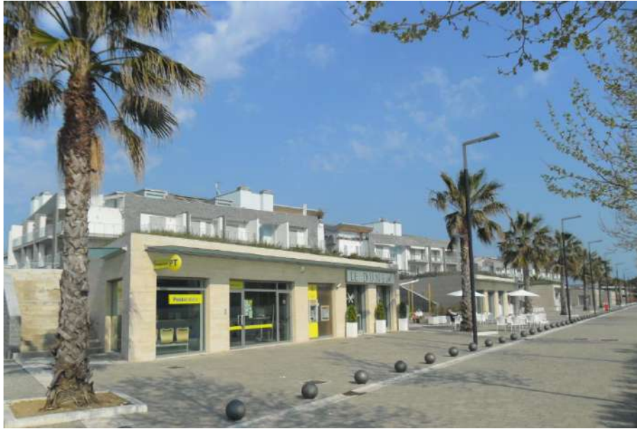
Complesso residenziale Le Dune – Servizi di quartiere

Dal punto di vista puramente ambientale, come sopra evidenziato, l'area è inserita in un contesto pienamente urbanizzato ed antropizzato. Nella zona in esame le condizioni meteorologiche sono generalmente di tipo mediterraneo, tipiche del litorale con influenze dovute alla presenza del vicino corso d'acqua costituito dal Fiume Piomba che nella sua parte terminale costituisce il confine tra la provincia di Pescara e quella di Teramo. Il clima è caratterizzato da inverni non molto rigidi e da percentuali di umidità atmosferica alte, sia d'inverno che d'estate.