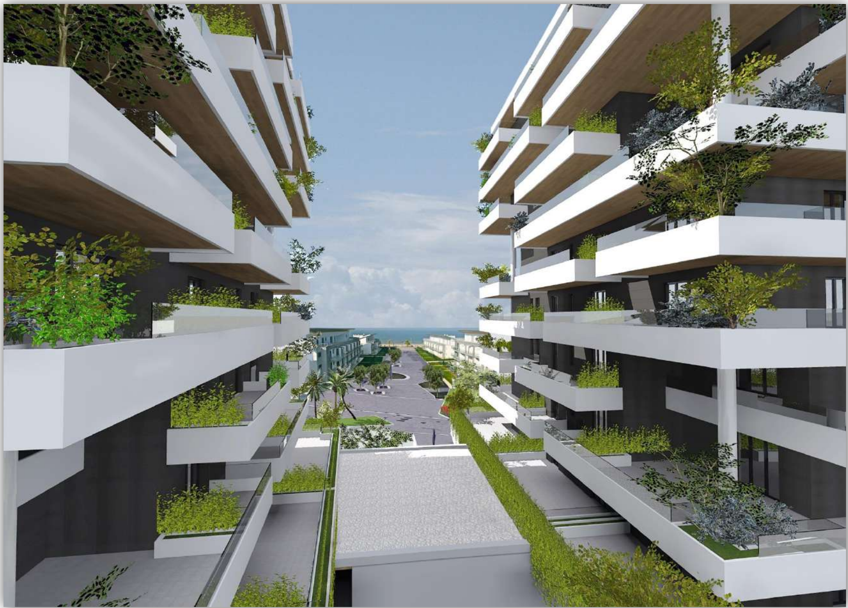
09_RENDERING: DETTAGLIO DELLA VISUALE VERSO IL FRONTE MARE