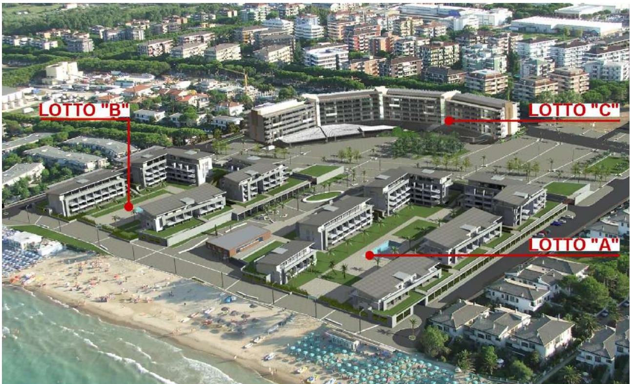
Piano di Lottizzazione approvato: Veduta aerea da Nord-Est

Nel rispetto di quanto approvato con la Variante al Piano di Lottizzazione di cui alla Convenzione Urbanistica del 30 luglio 2007, il progetto del "Lotto C" già assentito con Permesso di Costruire n. 100/2008/N rilasciato dal Comune di Silvi in data 31.12.2008 prevede la realizzazione di un edificio a carattere intensivo a destinazione residenziale e commerciale, dimensionato secondo i seguenti indici e parametri edilizi.