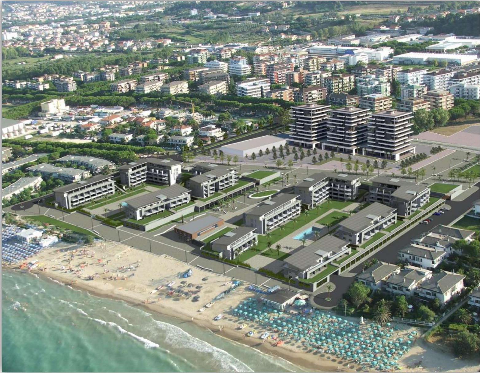
02_RENDERING: VEDUTA AEREA DA NORD-EST