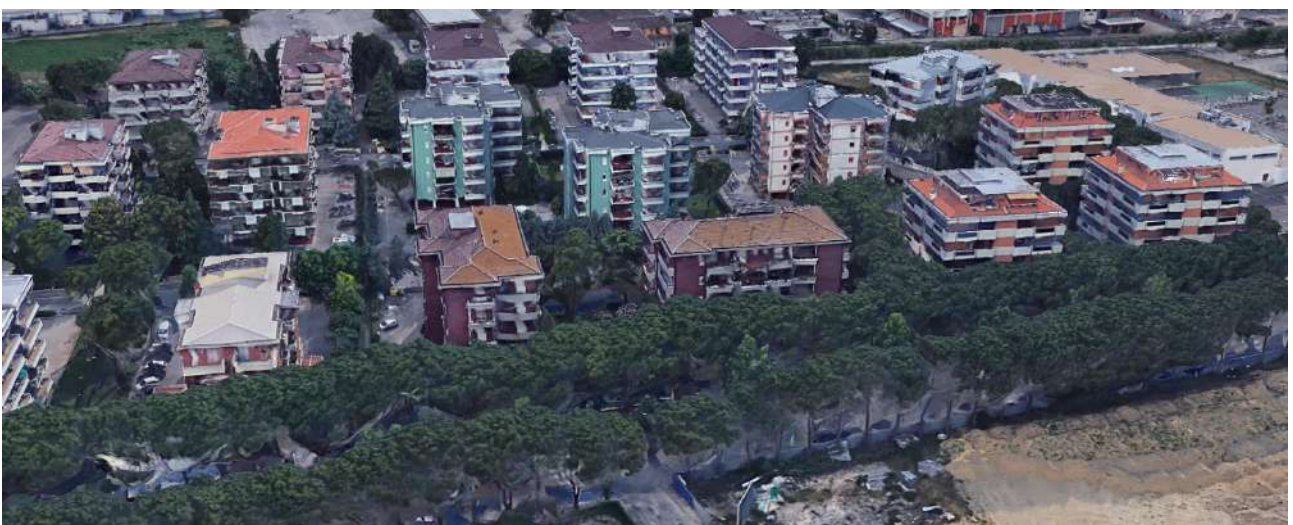
Assetto urbano esistente lungo Via L. Da Vinci

Per quanto concerne il contesto urbano nel quale è inserita l'area di intervento, questo è costituito prevalentemente da edifici residenziali costituiti da condomini pluripiano con relative aree di pertinenza attrezzate a parcheggio e/o a giardino.